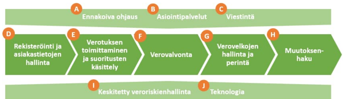
Kuva 1. Veroviranomaisen toiminnan yleinen viitekehys (mukaillen lähteestä: OECD).

Toiminnan tuloksellisuutta kuvataan seuraavassa osa-alueittain OECD:n veroviranomaisen toiminnan yleisen viitekehyksen mukaan jaoteltuna (Kuva 1). Kirjaimilla merkittyjen osa-alueiden jälkeen kuvataan Verohallinnon kansainvälistä toimintaa sekä roolia kestäväen kehityksen ja sukupuolten välisen tasa-arvon edistämässä. Asiakaskokemukseen liittyviä näkökohtia sekä Veronsaajien oikeudenvilvontayksikön ja Tulorekisteriyksikön toimintaa kuvataan kappaleessa 1.5.2 Palvelukyky sekä suoritteiden ja julkishyödykkeiden laatu .